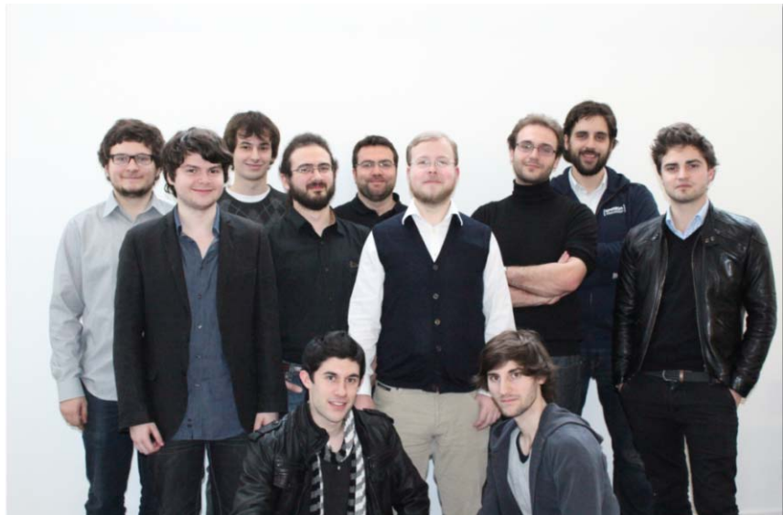
Equipe de l'Epitech Innovation Hub

Sur la base du volontariat ou après recommandation des équipes pédagogiques de l'école, les étudiants d'Epitech souhaitant s'impliquer dans le Hub peuvent y soumettre leur candidature. Les talents sélectionnés débutent leur parcours par une découverte des 5 domaines à travers les projets transverses incubés puis se spécialiseront en fonction de leurs ambitions professionnelles et de leurs centres d'intérêt.